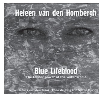
Heleen van den Hombergh Blue Lifeblood

TBH1801 www.haraldwalkate.com/hadrians-wall