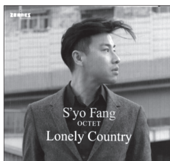
S'yo Fang Octet Lonely Country

QFTF Records QFTF/112 LC-51341 www.maaikedendunnen.com